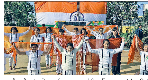
चरखीदादरी। सांस्कृतिक कार्यक्रम प्रस्तुत करते विद्यार्थी।