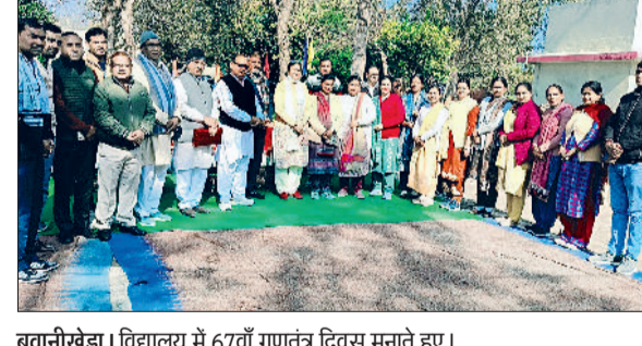
बवानीखेड़ा। विद्यालय में 67वें गणतंत्र दिवस मनाते हुए।