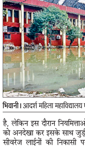
भिवानी। आदर्श महिला महाविद्यालय परिसर में भरा सीवरेज का गंदा पानी।

जनस्वास्थ्य विभाग व डीसी को शिकायत के बावजूद नहीं हो रहा समाधान: बुवानीवाला