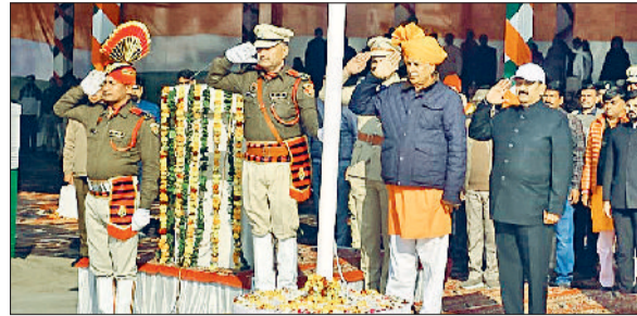
चरखी दादरी। परेड की सलामी लेते सांसद धर्मबीर सिंह।

देश के युवाओं का दिमाग और उनकी सोच भारत का विकसित राष्ट्र की ओर बढ़ता कदम है, पूरी दुनिया में सबसे अच्छा दिमाग हमारे युवाओं के पास है। देश में प्रधानमंत्री नरेंद्र मोदी की 2047 तक विकसित भारत की सोच के अनुरूप काम हो रहा है, इसी का नतीजा है कि अब भारत में ही बड़े स्तर पर रक्षा उपकरण तैयार किए जा रहे हैं, ये बात भिवानी महेंद्रगढ़ लोकसभा क्षेत्र से सांसद धर्मबीर सिंह ने गणतंत्र दिवस पर आयोजित समारोह की संबोधित करते हुए कही। सांसद ने पहले रोज गार्डन में शहीद स्मारक पर