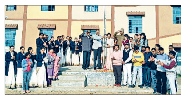
भिवानी। कार्यक्रम में ध्वज फहराते हुए।